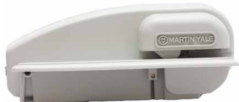
Opération d'une seule main